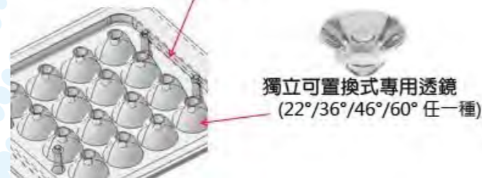
獨立可置換式專用透鏡 (22°/36°/46°/60° 任一種)